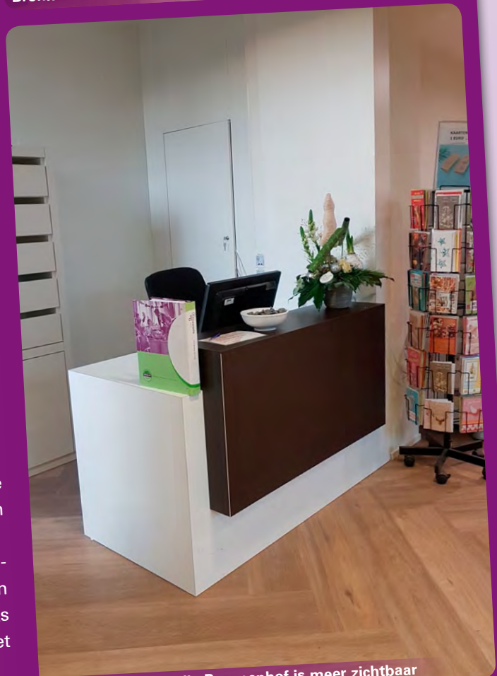
Nieuwe receptiebalie Bronnenhof is meer zichtbaar