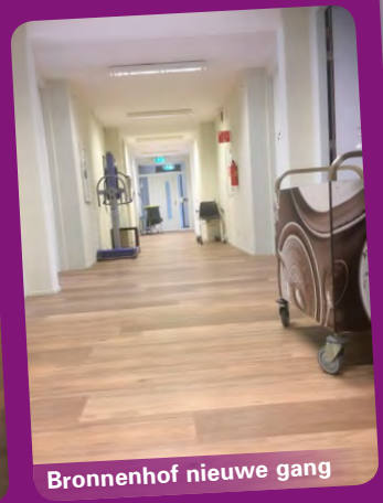
Bronnenhof nieuwe gang