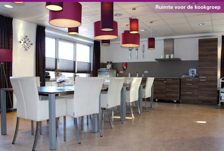
Ruimte voor de kookgroep