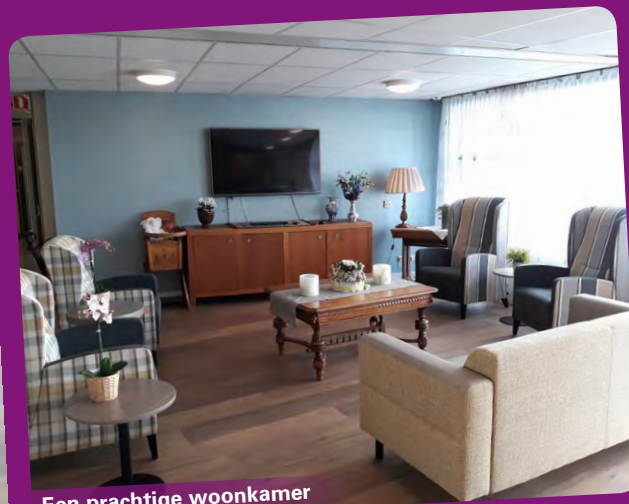
Een prachtige woonkamer