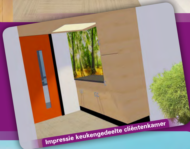
Impressie keukengedeelte cliëntenkamer