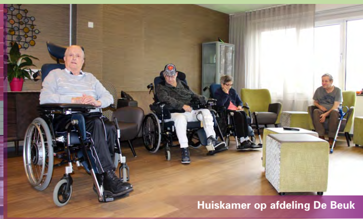
Huiskamer op afdeling De Beuk