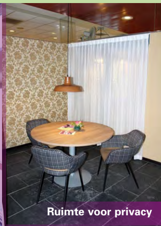
Ruimte voor privacy