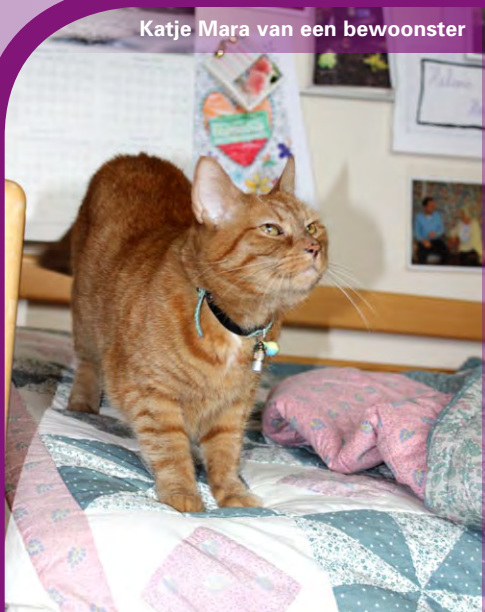
Katje Mara van een bewoonster