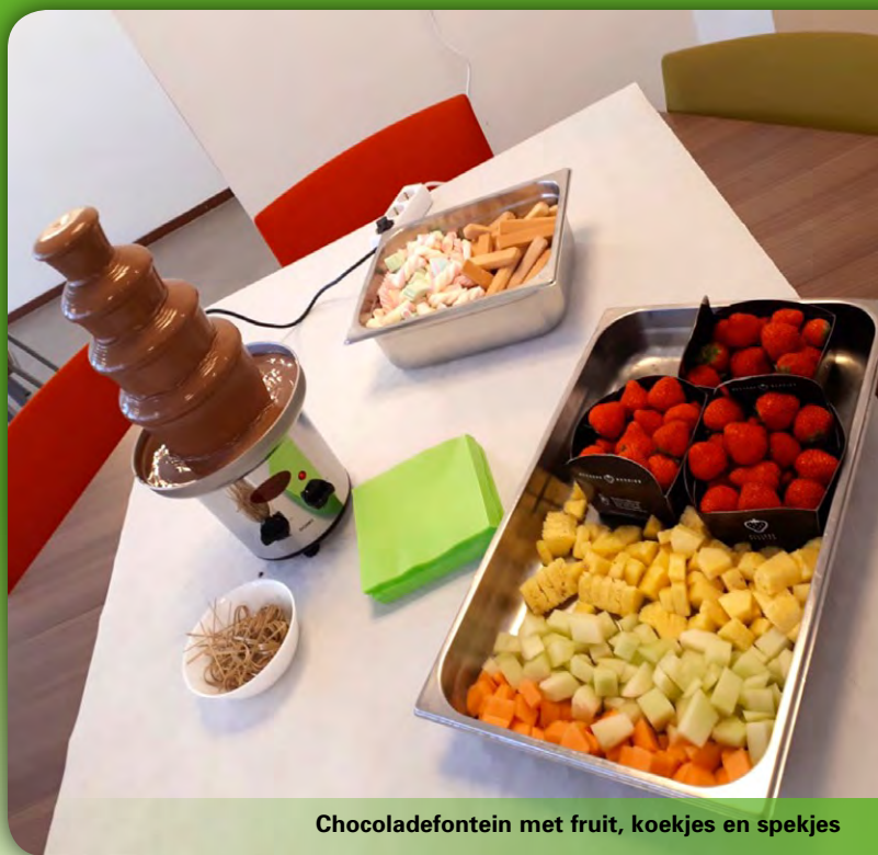
Chocoladefontein met fruit, koekjes en spekjes