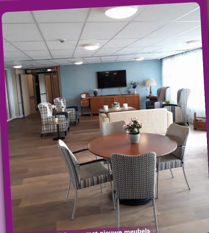
Oplevering huiskamer met nieuwe meubels