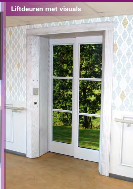
Liftdoors met visuals