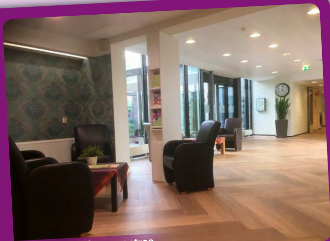
Bronnenhof nieuwe entree

Via deze weg willen wij dan ook iedereen, nogmaals bedanken die deze metamorfose mogelijk heeft gemaakt.