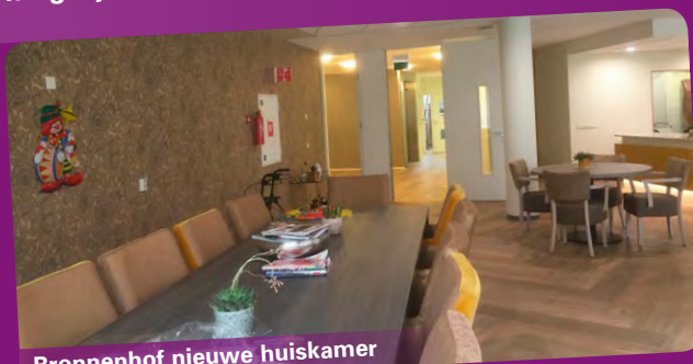
Bronnenhof nieuwe huiskamer