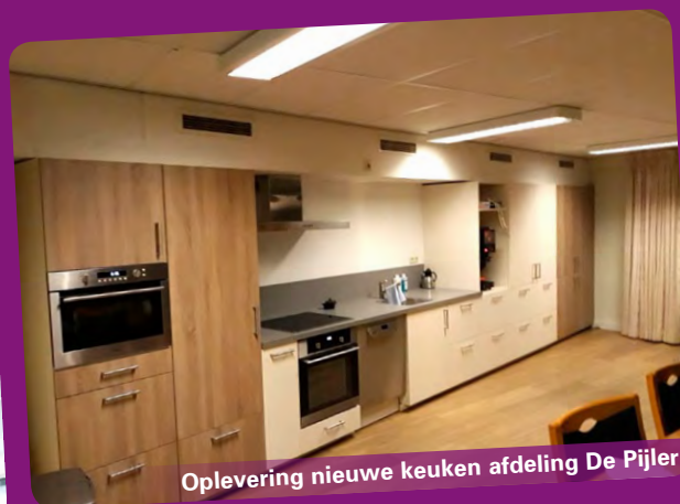
Oplevering nieuwe keuken afdeling De Pijler