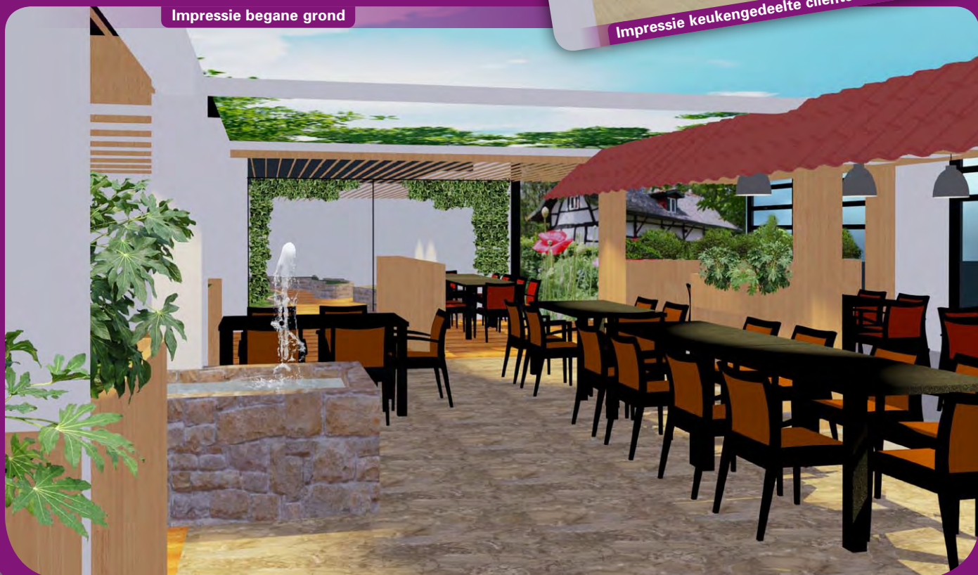
Impressie begane grond