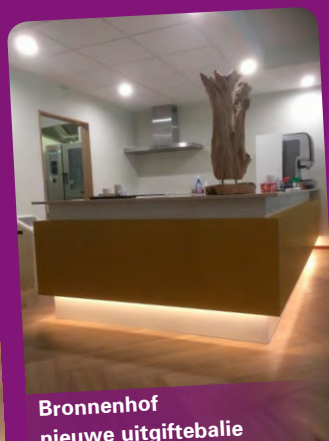
Bronnenhof nieuwe uitgiftebalie