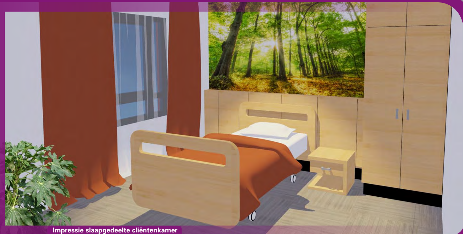
Impressie slaapgedeelte cliëntenkamer

Let wel: het zijn impressies in de letterlijke zin van het woord en geen exacte weergave van hoe het er straks uit komt te zien. Definitieve kleur- en materiaalkeuzes worden op een later moment gemaakt, in overleg met diverse deskundigen. Voor wat betreft de inrichting van de cliëntenkamers krijgen diverse stakeholders, waaronder uiteraard de cliënten zelf, de gelegenheid om deze vooraf te beoordelen.