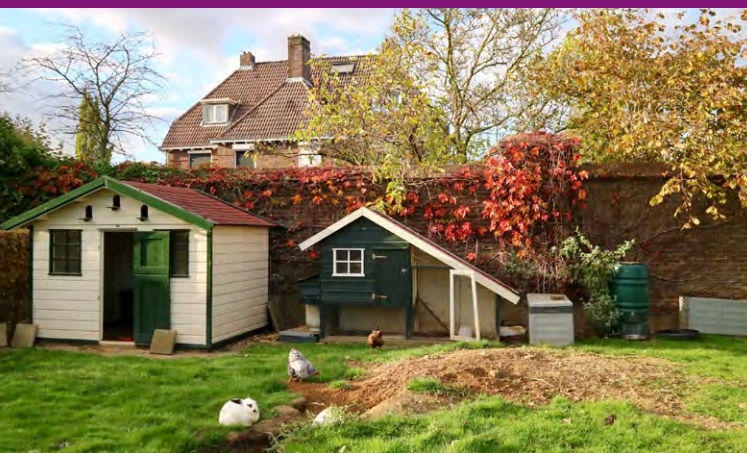
De tuin van zorgcentrum Emmastaete