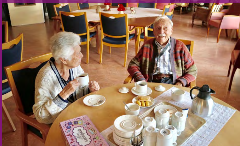
Samen leven is het motto