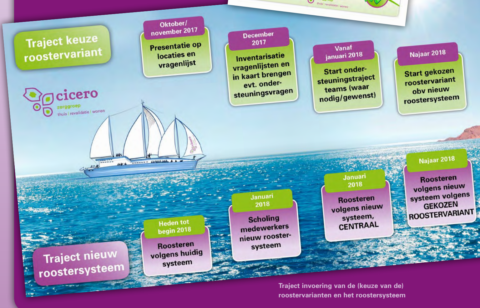
Traject invoering van de (keuze van de) roostervarianten en het roostersysteem