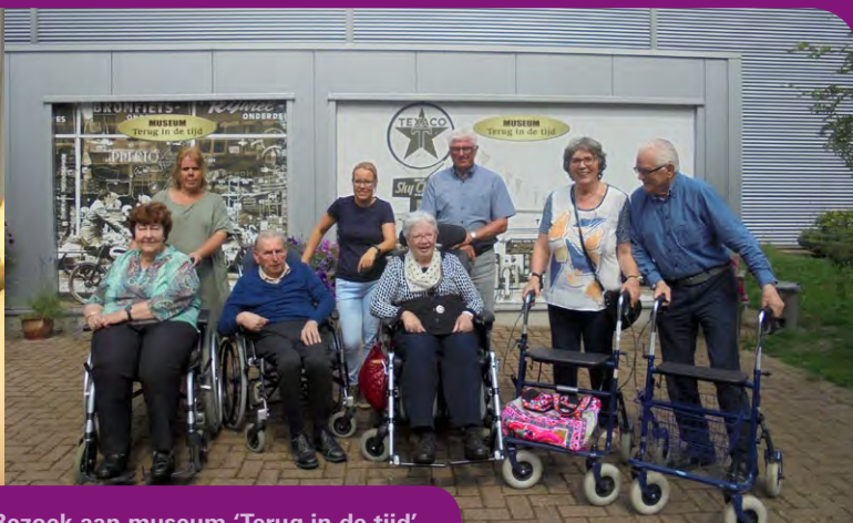
Bezoek aan museum 'Terug in de tijd'