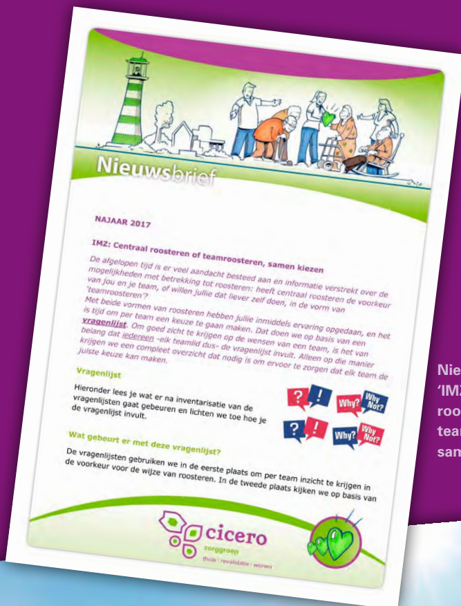
Nieuwsbrief 'IMZ: Centraal roosteren of teamroosteren, samen kiezen'

Afgelopen periode hebben op alle locaties bijeenkomsten plaatsgevonden, waarin het bovenstaande is toegelicht, mede aan de hand van een filmpje en een nieuwsbrief. Tevens is visueel in kaart gebracht hoe de invoering van de (keuze van de) roostervarianten en het roostersysteem in de tijd eruit gaat zien.