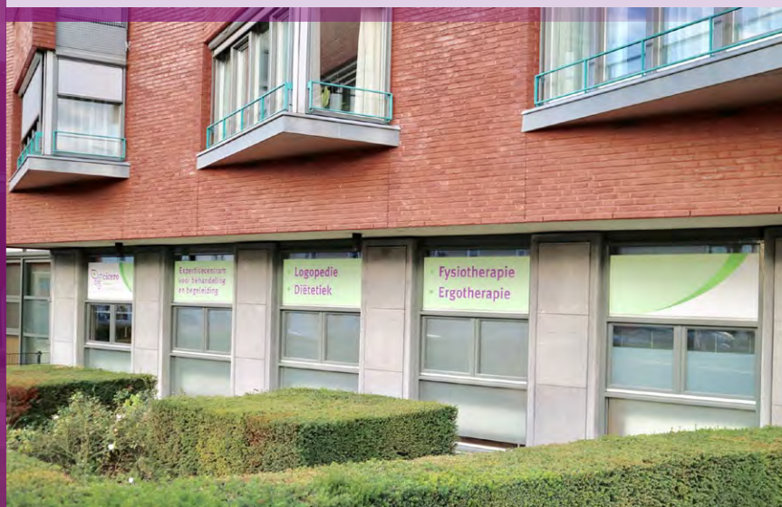
Cicero Expertisecentrum voor Behandeling en Begeleiding