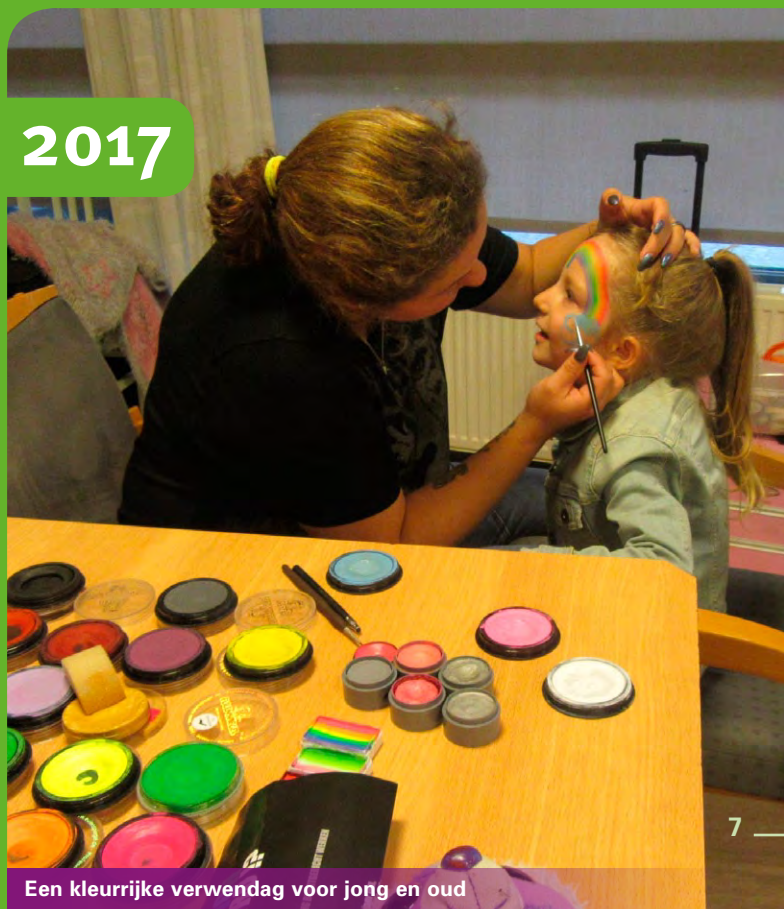
Een kleurrijke verwendag voor jong en oud

In de ochtend konden onze cliënten een mooi bloemstukje maken. In de middag trad goochelaar Mostafa op en de middag werd muzikaal omlijst door zanger Sjef Vanloo. Als blijvende herinnering aan deze mooie dag hadden de cliënten de mogelijkheid om zelf of samen met familie op de foto te gaan en deze foto ook te bestellen!