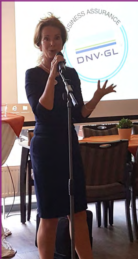
We mogen met z'n allen weer trots zijn op het resultaat!