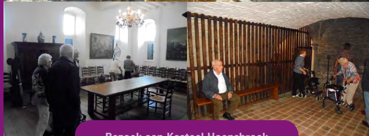
Bezoek aan Kasteel Hoensbroek