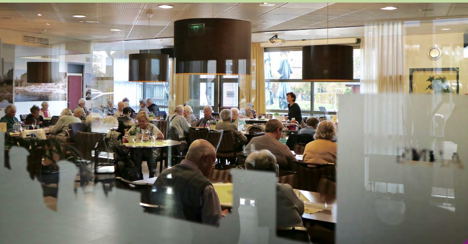
Gezelligheid onderling is belangrijk

→ vervolg locatie in beeld zorgcentrum Emmastaete