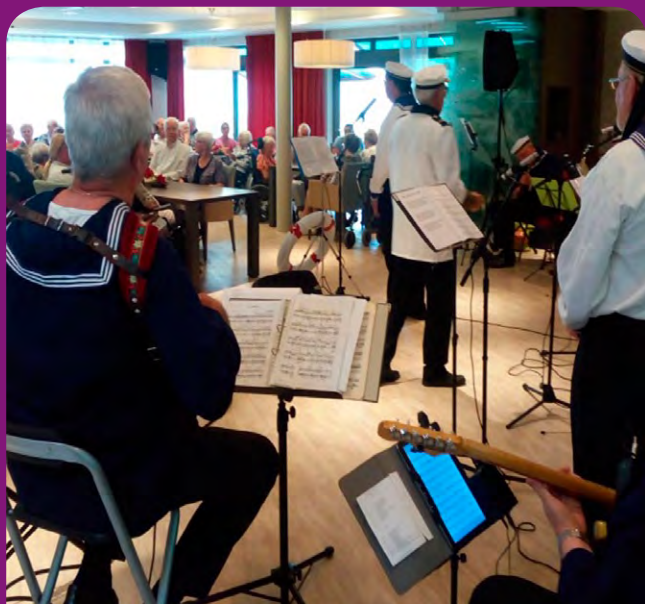
Diverse optredens van de Elvira Blaaskapel, het Oranje Shanti Koor Schinveld en het Senioren Orkest Onderbanken