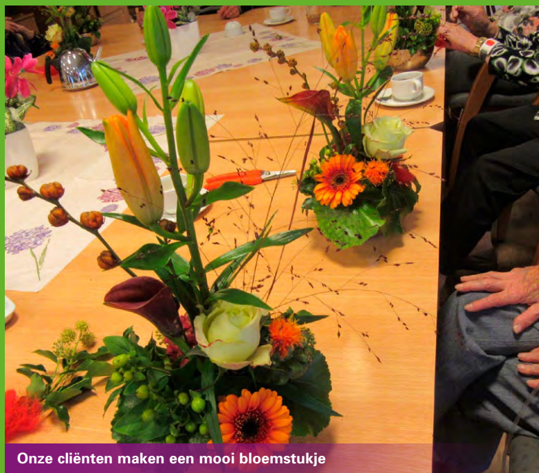
Onze cliënten maken een mooi bloemstukje

Al met al zijn we blij dat we weer een mooie dag voor onze cliënten hebben kunnen organiseren. Het was geweldig om te zien hoe onze cliënten van deze dag genoten hebben! Van A tot Z was het plaatje helemaal compleet.