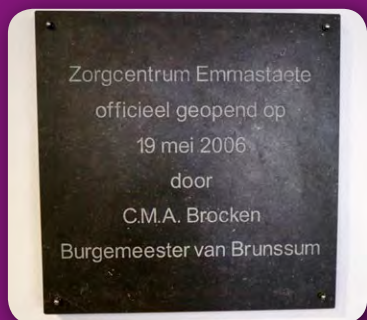
Zorgcentrum Emmastaete officieel geopend op 19 mei 2006 door C.M.A. Brocken Burgemeester van Brunssum