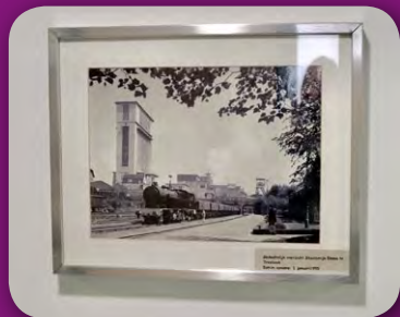
Zorgcentrum Emmastaete ligt op het voormalige terrein van Staatsmijn Emma